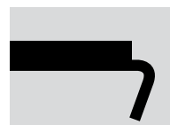
EZ SB Segmentin korkeus: 8 mm

Ero SB:n (pieni segmentti) ja BB:n (isompi segmentti) välillä on segmentin korkeudessa. Jotta segmentit pystyttäisiin erottamaan toisistaan myös käytettyinä, on SB-segmentin kulmat pyöristetty.